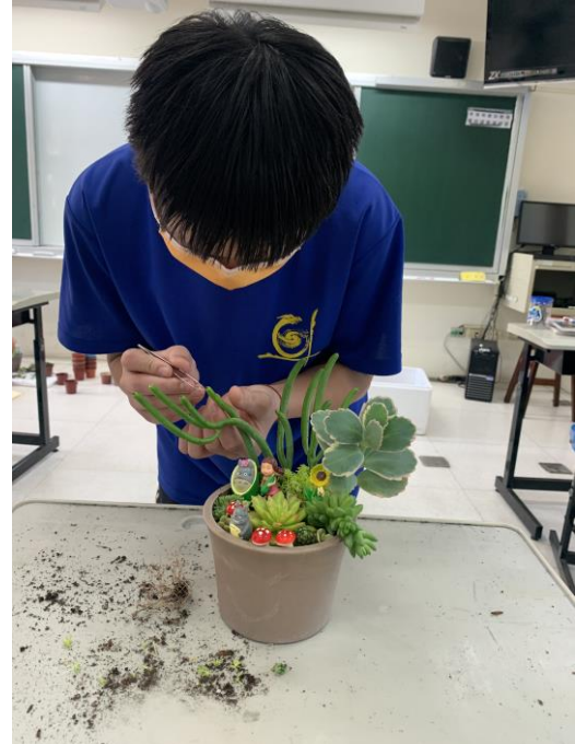
透過園藝活動增進學生成就感