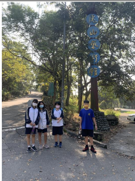
坐而言不如起而行-虎山健行去