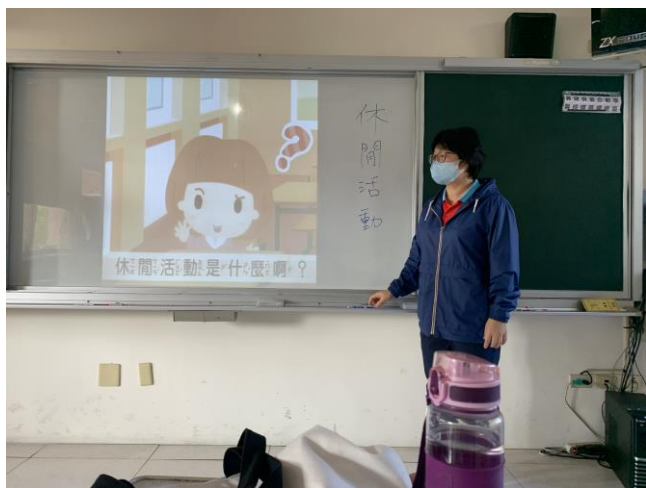
學習如何規畫空閒時間並進行休閒活動