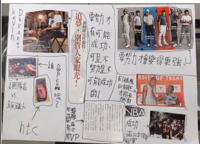
透過剪貼活動描繪出何謂“成功”的定義