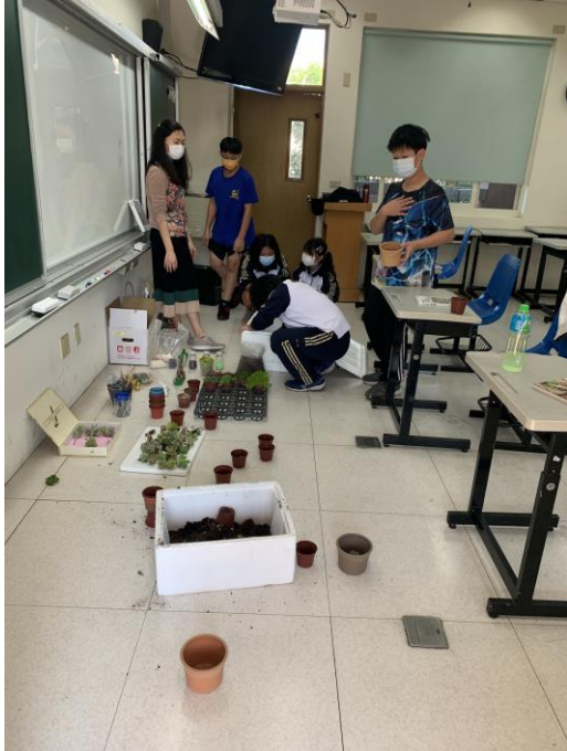
製作小盆栽-美化環境&淨化心靈