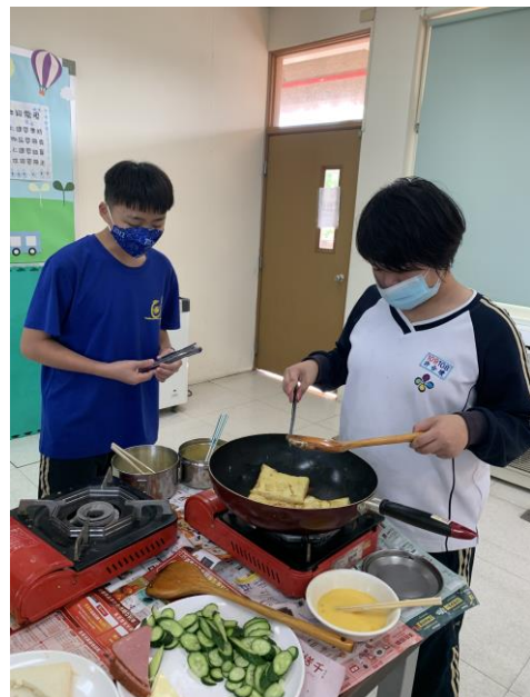
動手自己做營養又好吃