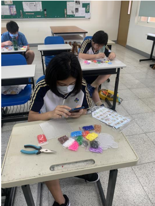
色彩繽紛的拼豆吸引學生發揮創意