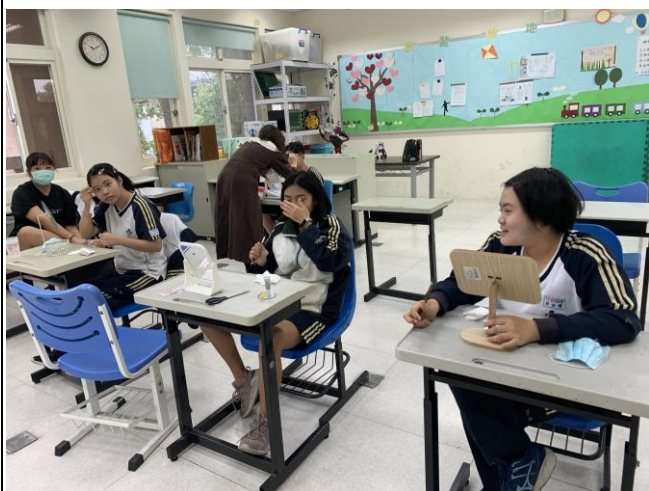
時尚就在我手裡-體驗化妝的神奇之術