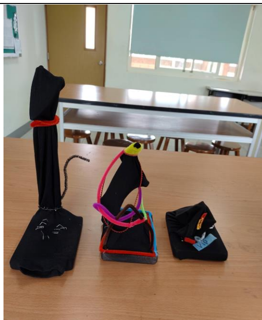
利用生活小物如絲襪製作獨一無二藝術品