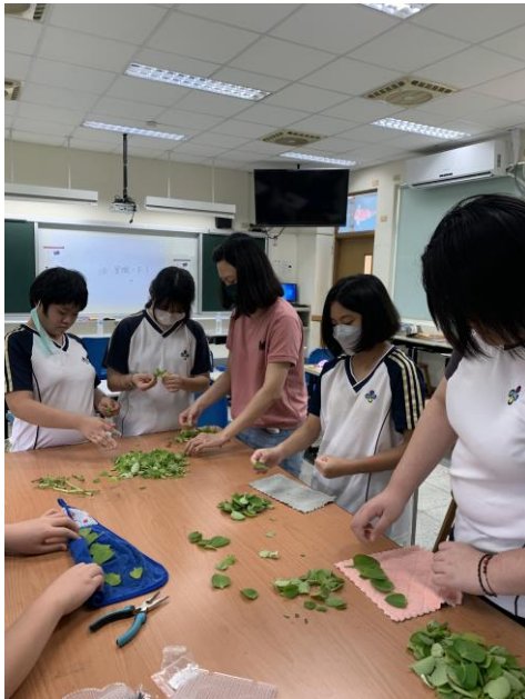
製作左手香膏的過程考驗學生耐性