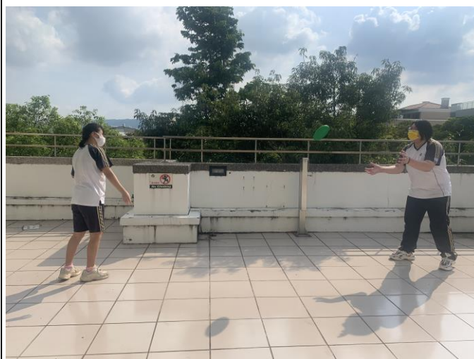
軟式飛盤-活動筋骨並兼具趣味