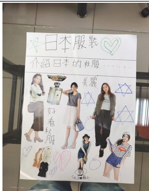
動手剪貼出心中的時尚