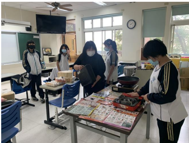
透過實作活動增進學生學習成就感