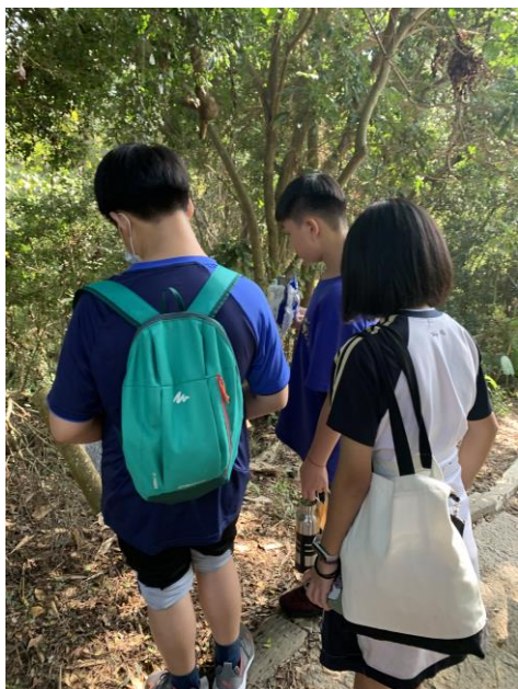
沿途觀察自然生態